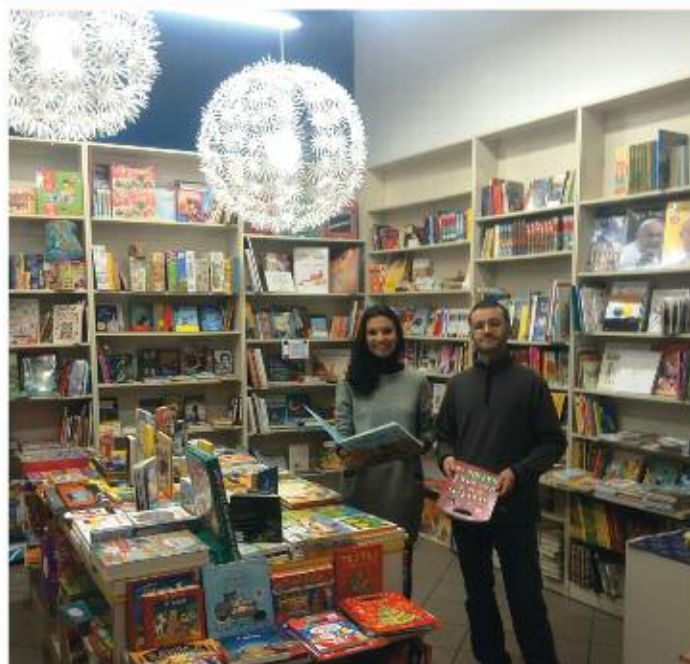
Uno scorcio accattivante della rinnovata libreria.