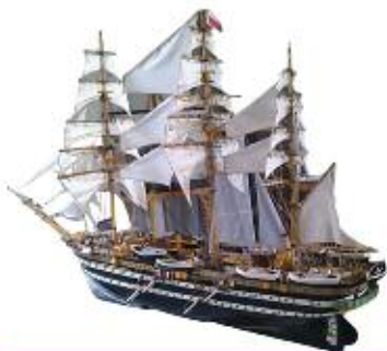
Un modello della A. Vespucci.

riesco proprio a stare fermo! In totale con la mia attività credo di aver conosciuto circa 6000 persone in tutta la Brianza, conservo i libri in cui i visitatori delle mie mostre lasciavano un piccolo pensiero. Tra le tante persone incontrate, mi piace però ricordare un capitano di Trezzo che ha lavorato per anni sulla Amerigo Vespucci ." ■