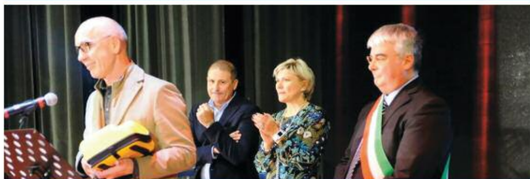
I rappresentanti della Aspecon insieme al sindaco durante la "Gügia d'òra" 2015.

S iamo quasi a fine anno e vogliamo fare un piccolo riassunto della gestione Aspecon per il 2015.